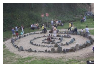
K2 Park Ravne2