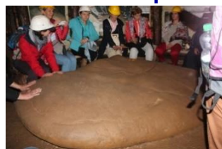
Megalitni kamen K2