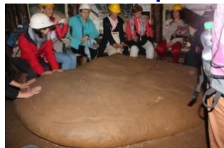
Megalitni kamen K2